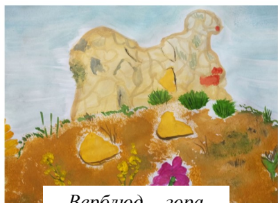
Верблюд - гора