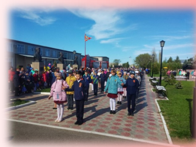
Танцуем Вальс Победы!