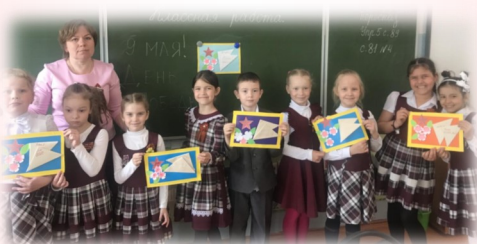
«Трудовичок» готовится к празднику 9 мая